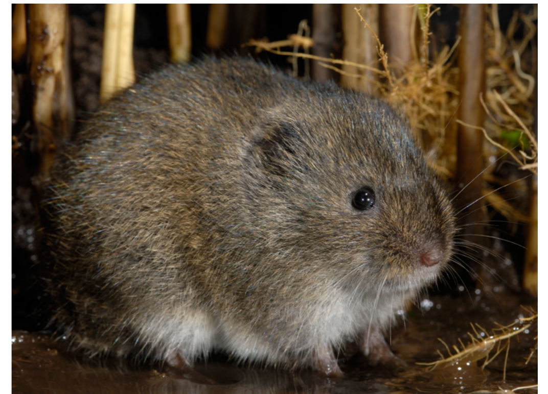
Noordse woelmuis, een prioritaire soort van de Habitatrichtlijn

De zes Natura 2000 gebieden in het IJsselmeergebied hebben op meerdere vlakken een onderlinge overeenkomst of afhankelijkheid. Zoals op het vlak van waterhuishouding, habitattypen, (het gebruik door) vogelsoorten en diverse activiteiten als visserij en recreatie. Vogelsoorten als visdief, zwarte stern en aalscholver foerageren, mede afhankelijk van richting en kracht van de wind, in het IJsselmeer of Markermeer. Recreanten doorkruisen per zeilboot diverse meren. Ook vindt er commerciële visserij plaats. De waterkwaliteit wordt vanuit het oosten beïnvloed door het water uit de IJssel. Het waterpeil wordt beïnvloed door het spuiregime in de Afsluitdijk, hoogwater op de IJssel en aanhoudende noordwestenwind over de Waddenzee die kan zorgen voor zulke hoge waterstanden dat zelfs bij laagwater niet kan worden gespuid. Door de gebieden samen te voegen in één beheerplan, is het mogelijk om de maatregelen en de eventuele regulering van menselijke activiteiten voor de verschillende gebieden in samenhang te bezien.