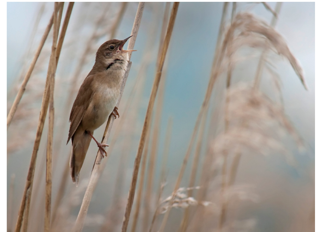
Zingende grote karekiet

In onderstaande paragrafen zijn alleen de soorten opgenomen die in één of meerdere gebieden knelpunten hebben. Verder worden alleen de knelpunten beschreven die in de NEA naar voren zijn gekomen. Informatie over alle soorten en over de gebiedsspecifieke achtergrond van knelpunten is in hoofdstuk 3 van de verschillende gebiedsdelen te vinden.