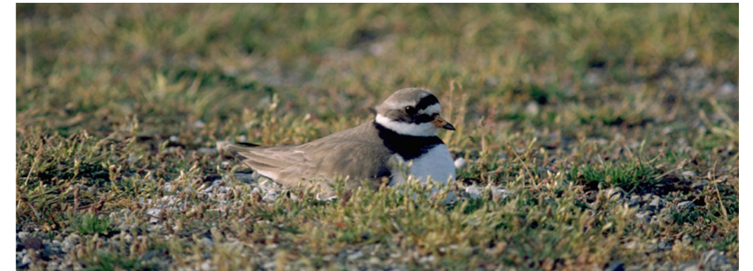
Bontbekplevier op schaars begroeide grond