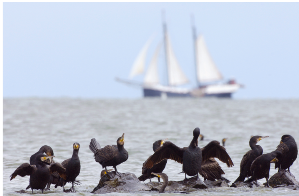
Rustende aalscholvers op stortstenen oever