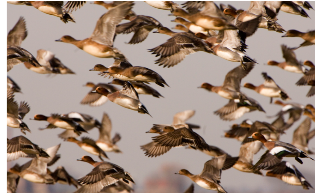
Vliegende groep smienten

Van een drietal soorten steltlopers die vooral foerageren en/of broeden op (natte) graslanden worden de doelaantallen uit de instandhoudingsdoelstellingen voor het IJsselmeer niet gehaald. Dit geldt voor