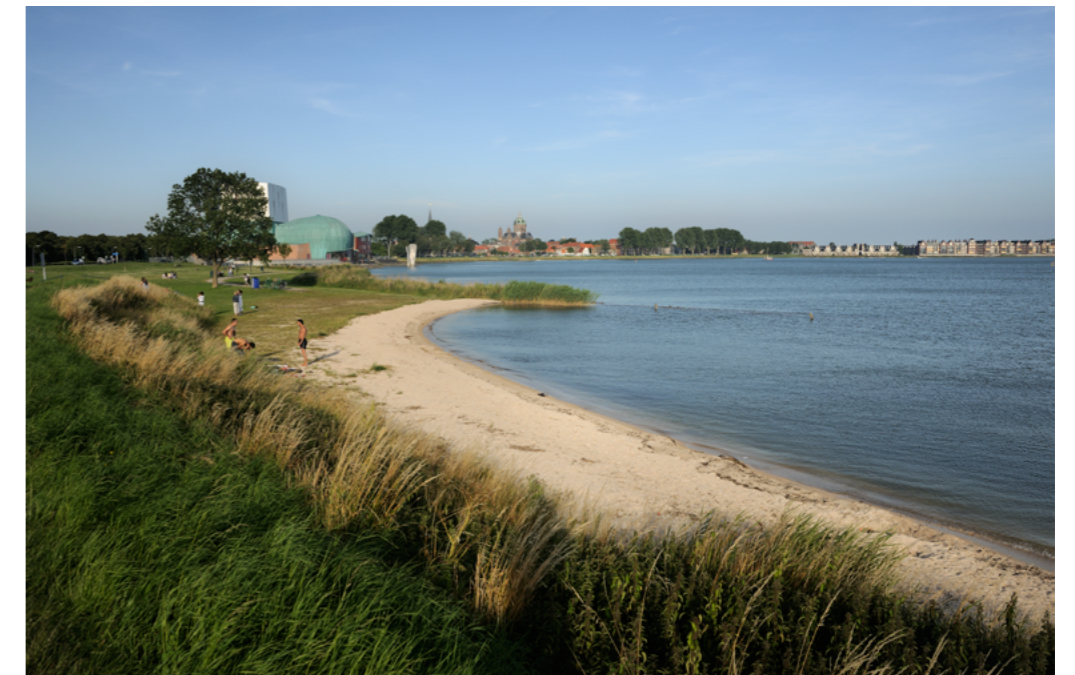
Recreatiestrandje bij Hoorn

Peilbeheer: Zowel het huidige als het toekomstige, flexibeler, peilbeheer kan worden voortgezet. Mitigatie van negatieve effecten van het huidige peilbeheer vindt plaats door herinrichting van de oeverzones van buitendijkse natuurgebieden, waardoor er geen consequenties zijn voor gebruikers van het gebied. Omdat het nieuwe peilbesluit zal leiden tot een flexibeler en een meer seizoensvolgend peilverloop, luidt de