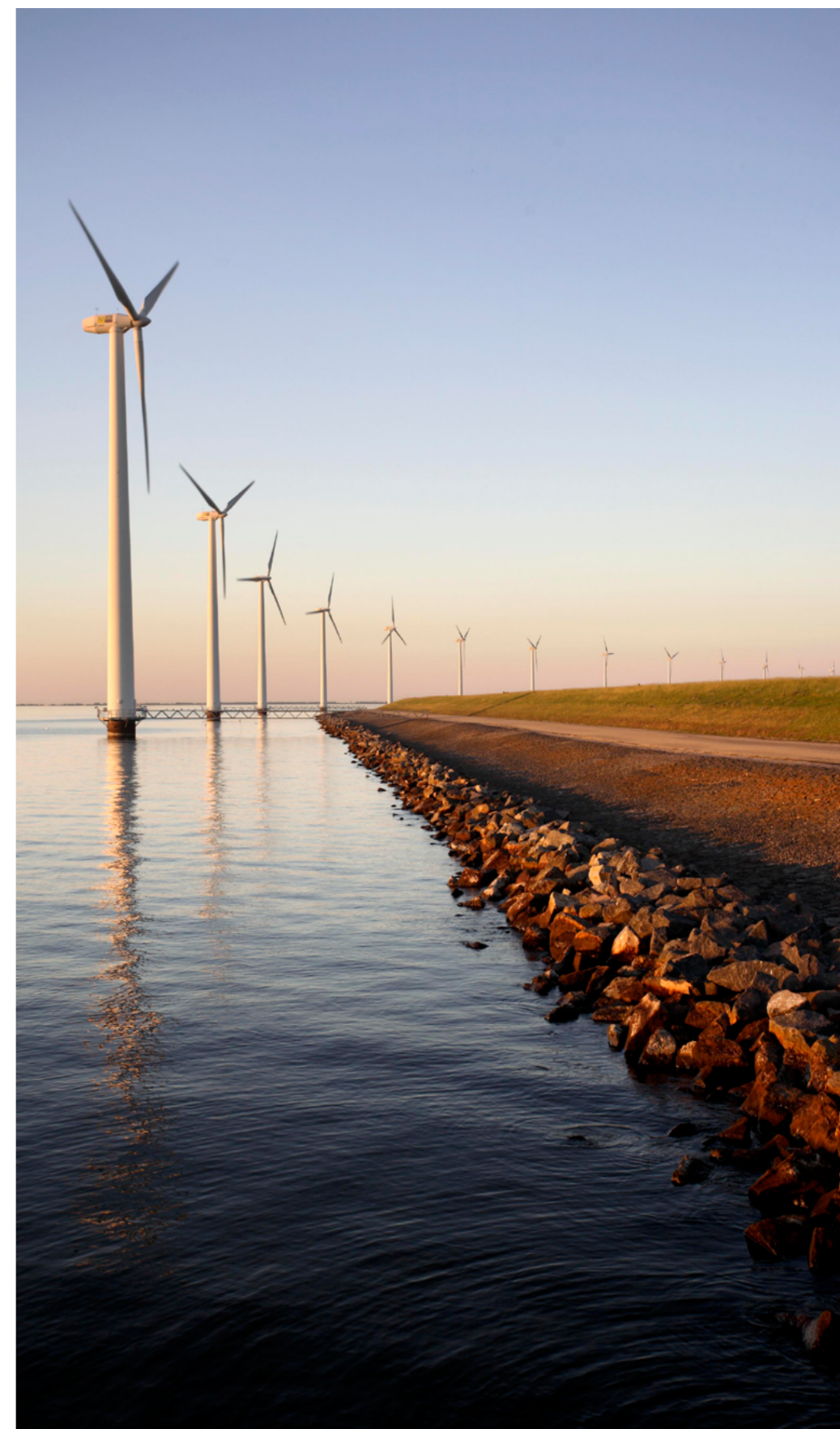
Rij windturbines langs de Noordoostpolderdijk