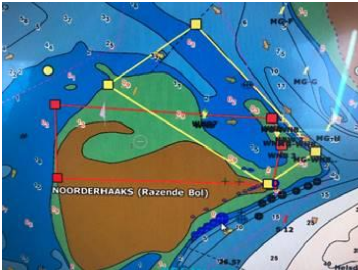
Figuur 1 Noorderhaaks (Razende Bol)